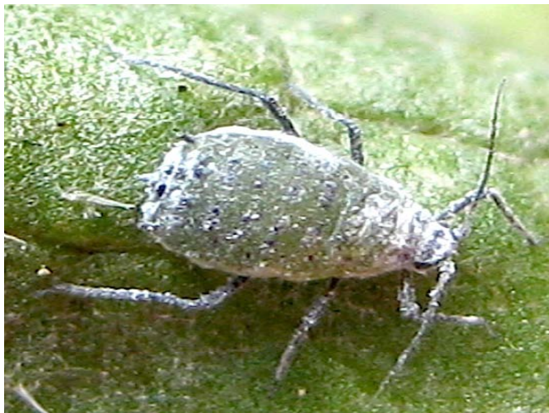
Figura 17. Adulto del pulgón de la col ( Brevicoryne brassicae L.).