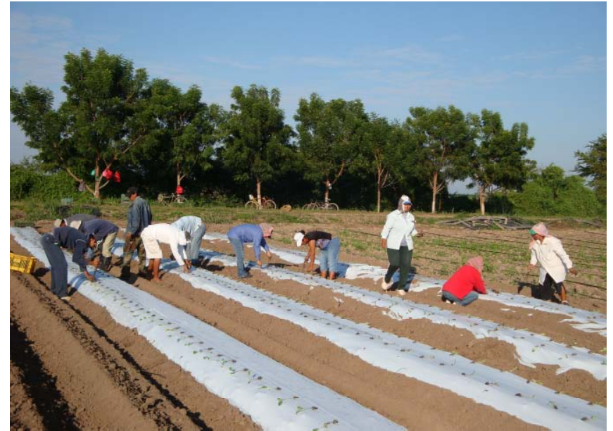
Figura 8. Trasplante de brócoli a doble hilera y acolchado.

riego rodado con gran éxito (seis riegos en total); sin embargo, dependerá del acceso y la disposición de agua de las zonas de producción.