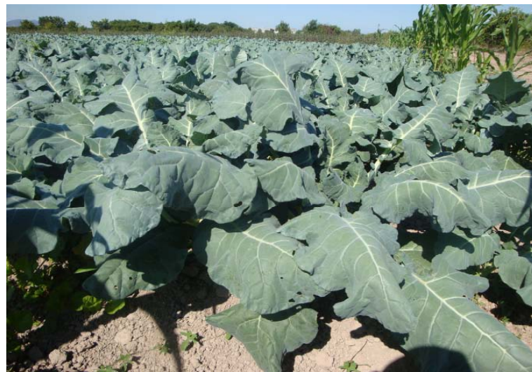
Figura 2. Crecimiento vegetativo en brócoli.

Durante esta fase, la planta solamente desarrolla hojas y tallos; las hojas son grandes y con gran cantidad de agua; los tallos son gruesos y fuertes, con alto contenido de humedad.