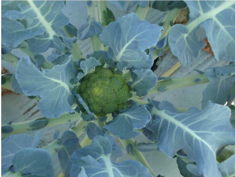
Figura 3. Inicio de floración de brócoli.

Durante esta etapa, se inicia la formación de la flor en el centro de la planta; tiene que pasar por un periodo de frío para poder iniciar con este proceso. Durante esta etapa la planta sigue emitiendo hojas, solo que de tamaño muy pequeño.