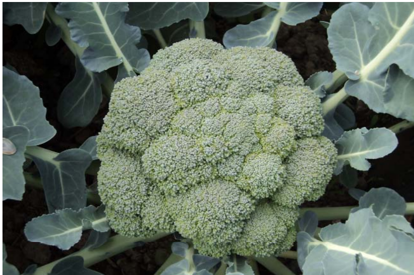
Figura 11. Cabeza de brócoli lista para corte, calidad para mercado en fresco.

con estos parámetros se determinó la calidad de las inflorescencias. El rendimiento alcanzado en el sur de Sinaloa se ubicó entre 11 mil 200 y 16 mil 587 kg/ha y un promedio de 290 y 539 gramos de peso por cabeza.