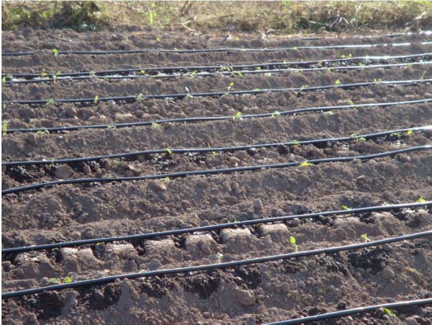
Figura 7. Sistema de riego por goteo.

Esta actividad consiste en depositar las plántulas en el suelo, ya sea de forma manual o mecanizada.