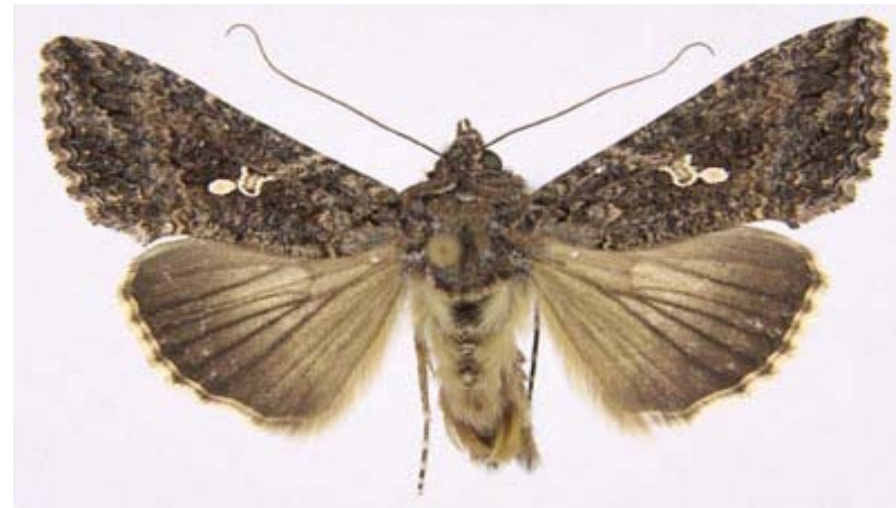
Figura 15. Adulto del gusano falso medidor ( Trichoplusia ni ).