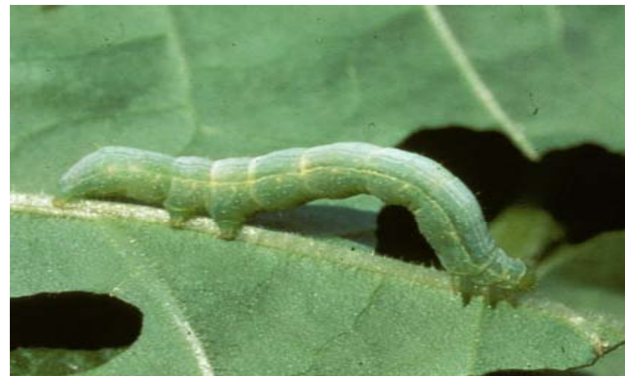
Figura 16. Larva del gusano falso medidor ( Trichoplusia ni ).