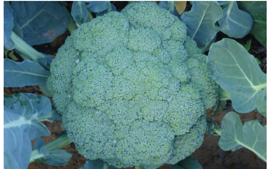
Figura 4. Formación de pella o cabeza lista para corte.

formación de las nuevas semillas, las cuales son de color café claro a café oscuro, redondeadas y muy pequeñas.