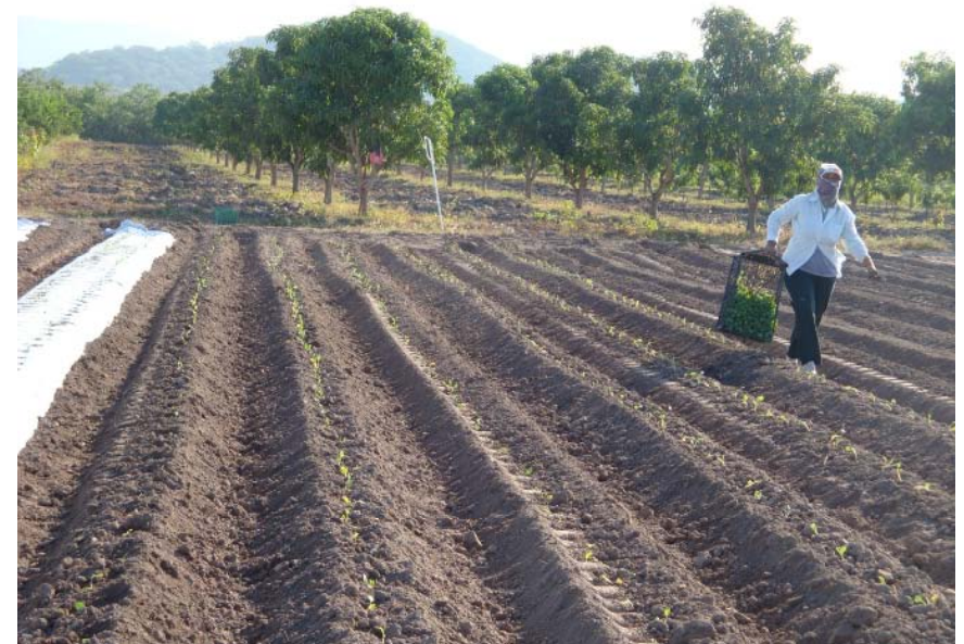
Figura 9. Trasplante de brócoli a hilera sencilla.