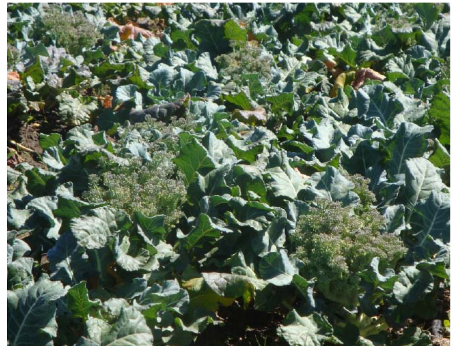
Figura 5. Inicio de floración de cabezas de brócoli