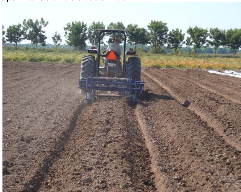
Figura 6. Formación de camas para el trasplante a doble hilera.

poblacional, para lo que se requiere de una cama amplia a cada metro, que permita la siembra a doble hilera.