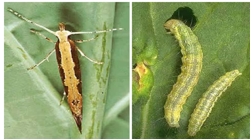
Figura 13. Adulto y larva de palomilla dorso de diamante ( Plutella xylostella ).

Hay muchos enemigos naturales que ayudan en el control de esta plaga, por ejemplo, en Honduras la avispa parasitoide Diadegma