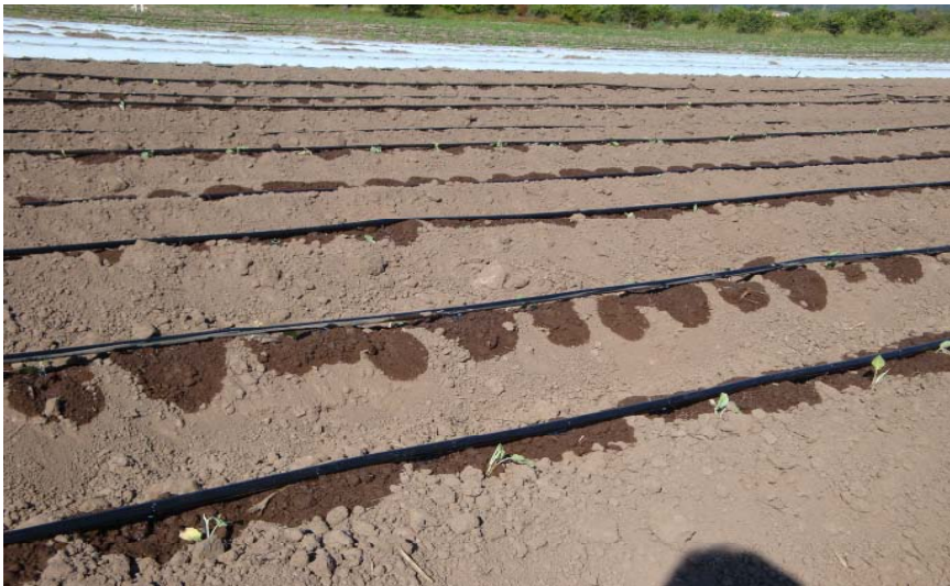
Figura 10. Riego del cultivo de brócoli durante el trasplante.