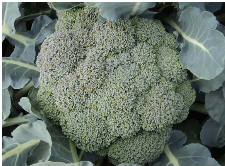
Figura 12. Cabeza de brócoli ligeramente madura ideal para la industria.