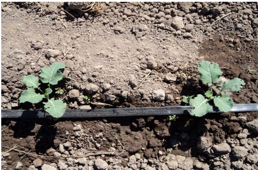
Figura 1. Distancia entre plantas de brócoli para una densidad de 33 mil plantas por hectárea.

Puede ser establecido de forma directa o trasplante, pero actualmente la mejor forma de establecimiento es a través de trasplante, debido que las nuevas variedades requieren de la siembra en charolas para aprovechar el 100 % de la semilla que se compra a las casas comercializadoras.